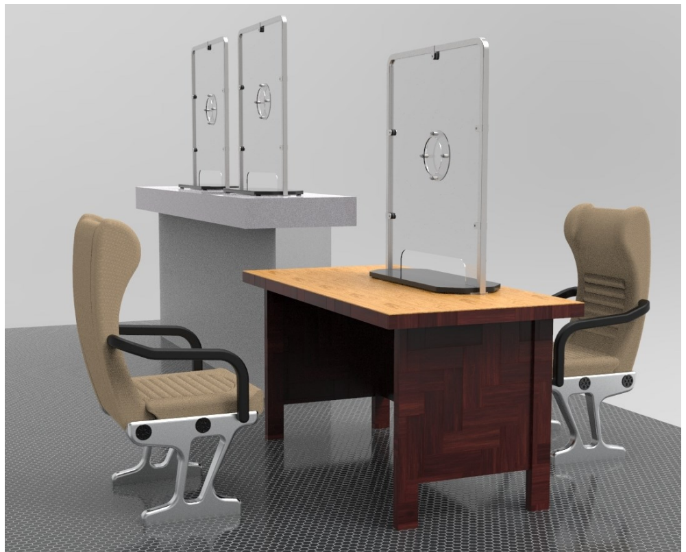
Utilisations du même protecteur sur bureau ou comptoir.

Le polycarbonate transparent de 3/16" d'épais assure une grande résistance aux éraflures et une durabilité légendaire en comparaison avec des panneaux d'acrylique beaucoup moins résistants.