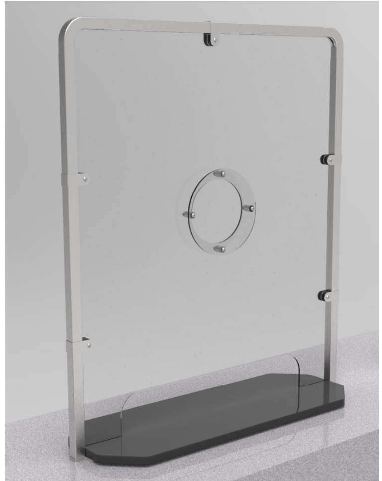
Protection portable multi-usages

Un cadre en acier inoxydable supporte un écran de polycarbonate de haute qualité doté d'un orifice de communication protégé et d'une fente d'échange de documents.